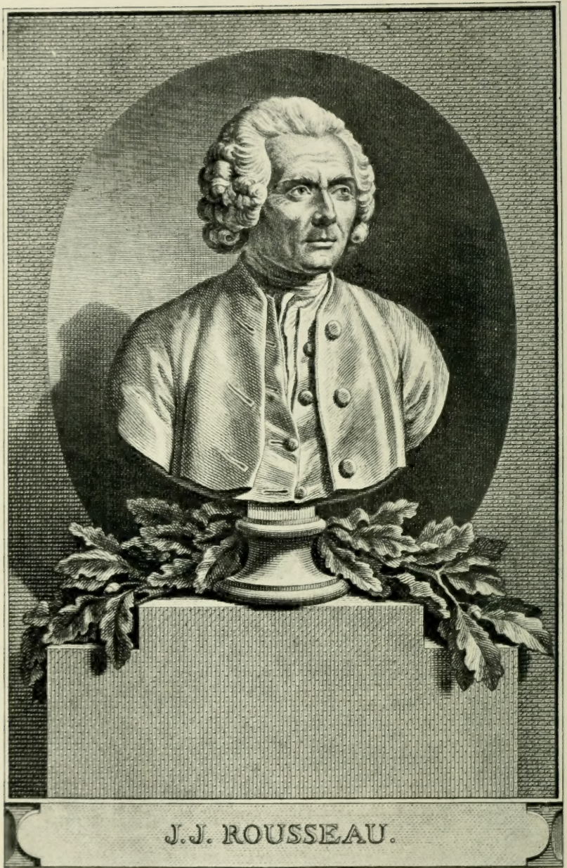
Nach einem Delvaux'schen Stich der Büste von Houdon.